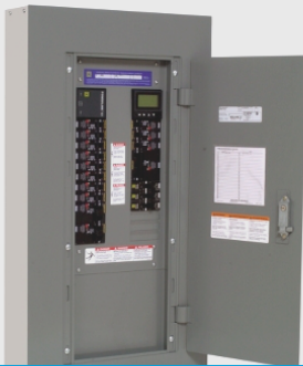
Centro de control de iluminación