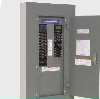
Centro de control de iluminación