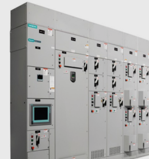
Centro de control de Motores (MCC)