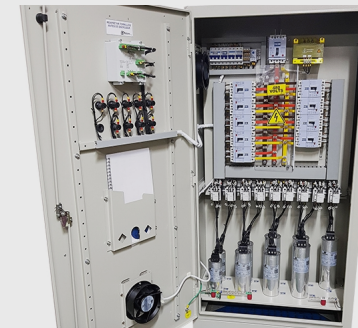
Correctores de Factor de Potencia