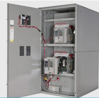
Interruptores de transferencias