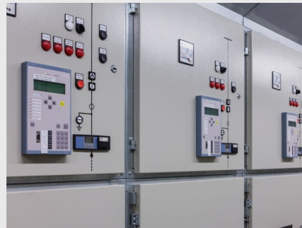
Celdas de Media Tensión