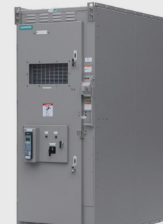
Seccionadoras de Media Tensión